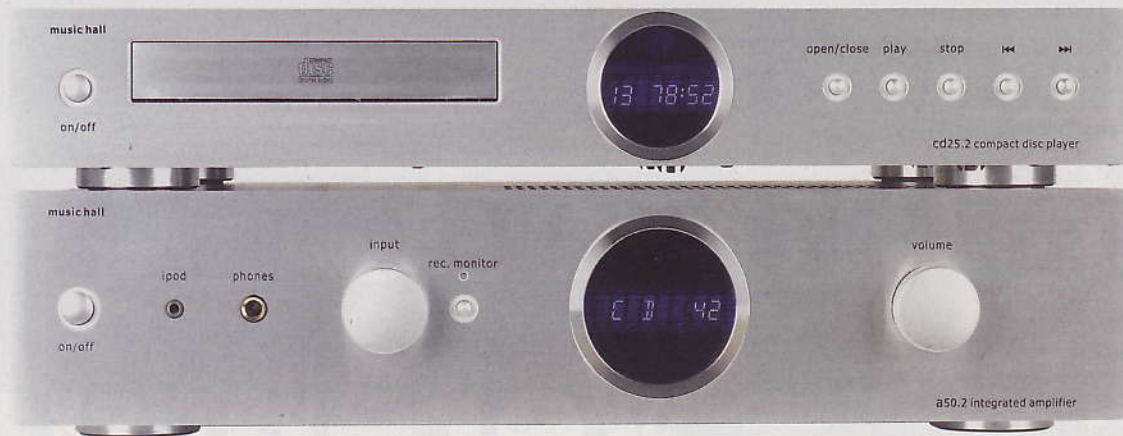
Für mehr Durchblick: Massive Metallfronten und das charakteristische Bullauge zeichnen die Music Halls aus

Mit der eleganten Fernsteuerung lassen sich alle Music-Hall-Geräte bedienen