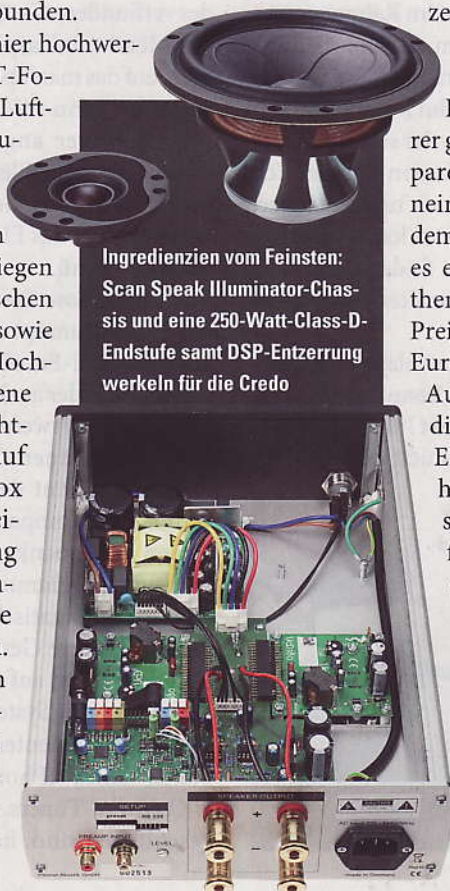
Ingredienzien vom Feinsten: Scan Speak Illuminator-Chassis und eine 250-Watt-Class-D-Endstufe samt DSP-Entzerrung werkeln für die Credo