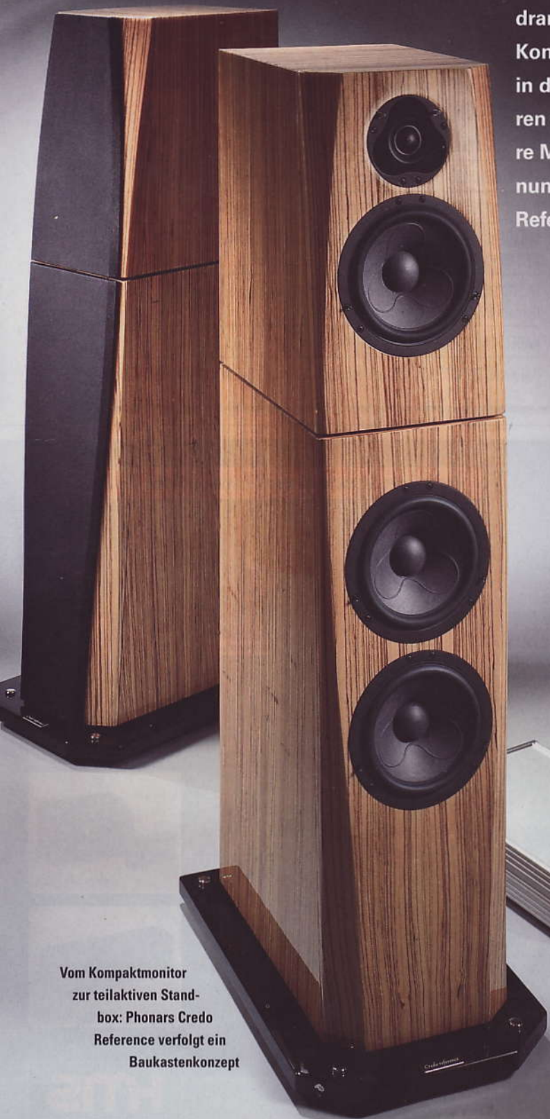
Vom Kompaktmonitor zur teilaktiven Standbox: Phonars Credo Reference verfolgt ein Baukastenkonzept

dramatisch guten Konzepten folgten in den letzten Jahren ambitioniertere Modelle – und nun die „Credo Reference“