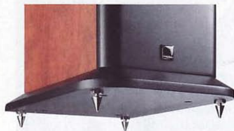
Der schwere Fuß sorgt für Standsicherheit, die verstellbaren Spikes für gute Entkopplung

Da die Bassreflex-Öffnung bei der S150G nach hinten abstrahlt, gilt es, einen Respektabstand zur Rückwand einzuhalten, soll die Phonar im Bass nicht aufschwimmen. Im Test zeigte sich, dass sich Experimentieren hier durchaus lohnt. Von Haus aus generieren die eher zierlich dimensionierten Tief-Mitteltönen-Chassis keine Erdbeben, die S150G lässt sich indes im Tieftönen mit dem Abstand ihres Rückens zur Wand sehr feinfühlig abstimmen. Frei aufgestellt, so haben wir getestet, überzeugt die norddeutsche Box mit einem sehr straffen, knackigen und „schnellen“ Bassbereich. So konnte sie durchaus auch tonal an die positiven Attribute ihrer größeren Geschwister erinnern, spielte sehr schön stimmig und flüssig mit tadelloser Struktur und einem guten Raumeindruck. Manche Tester vermissen etwas Wärme bei männlichen Gesangsstimmen, was man im Direktvergleich etwa mit der Canton GLE-490 oder der Quadral Rhodium 70 nachvollziehen kann. Einen Nachteil muss diese insgesamt etwas nüchternere Abstimmung aber gar nicht darstellen, qualifiziert sie die Phonar unserer Ansicht nach als empfehlenswert für jede Musikrichtung. Oberheraus „verrundet“ sie mitunter leicht, ohne zu verfärben, was sich angenehm in unseren Gesamteindruck einfügt und dazu verleitet, der Phonar länger zuzuhören, als es unser gelegentlich ziemlich enger Zeitplan zulässt. Auch das ein Erbe der höheren Phonar-Modellreihen, das wir hier gern anerkennen.