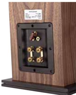
Die Steckbrücke justiert auf Wunsch den Hochtonanteil

Die beiden 130-mm-„HDS“-Tiefmitteltöner stammen aus dem Hause Peerless und werden in der P4 im Rahmen einer Zweieinhalb-Wege-Konstruktion eingesetzt. Das bedeutet gewissermaßen eine aus den beiden oberen Treibern bestehende Kompaktbox, die in den unteren Lagen mit einem im selben Gehäuse befindlichen Subwoo-